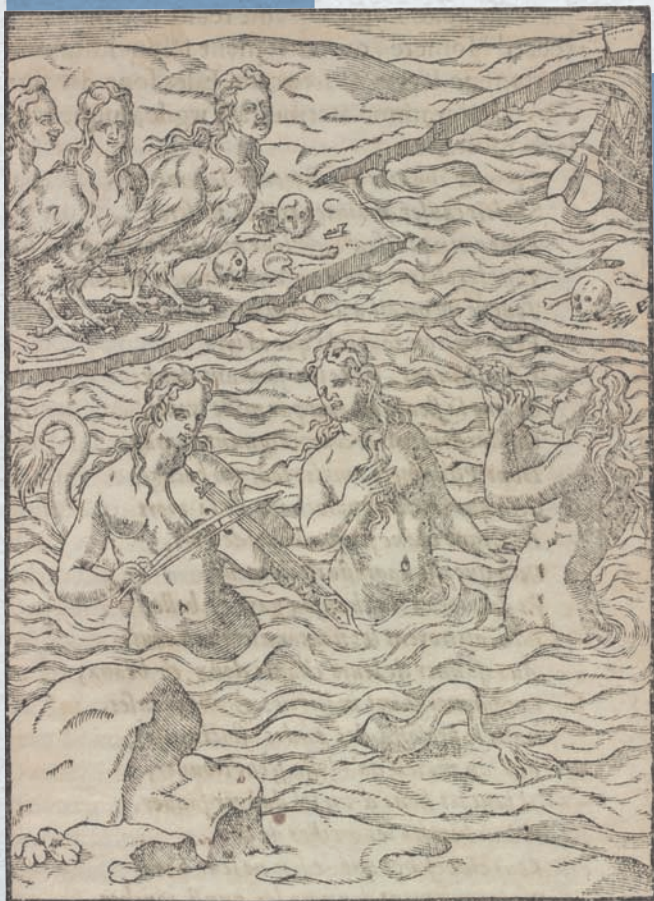
Cartari, Les Images des dieux , Lyon, Frelon, 1610, p. 321 gallica.bnf.fr/BNF

LES IMAGES DES DIEUX DANS L'EUROPE DE LA PREMIÈRE MODERNITÉ (XVI e – XVIII e SIÈCLES)